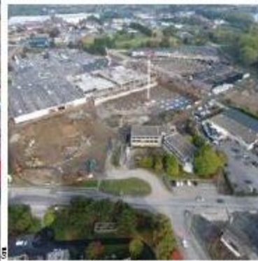
Depuis le ciel, on perçoit également ce à quoi ressemblera le futur commercial de police, soit les anciens locaux d'Oras au centre de la photo.