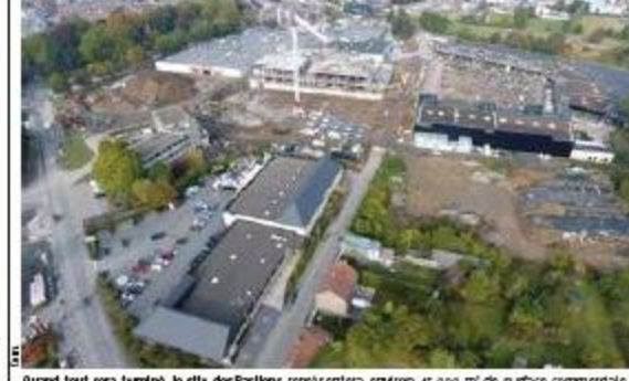
Quand tout sera terminé, le site des Bastions représentera environ 45 000 m 2 de surface commerciale.

Des chiffres vertigineux Selon les chiffres fournis par l'association momentanée des entreprises chargées des travaux - Willemien Frank de Fiemalle - la dalle au sol représentant 60 % de la superficie du Niveau -1 en cours de préparation, nécessitera 2 150 m 3 de béton. Pour la première phase (parking souterrain de 200 places), 1700 m 3 de béton ont été coulés. Pour l'ensemble du chantier, le bureau d'études de Wereldhave a prévu un million de kg d'acier d'armature pour le béton. Actuellement environ 500 tonnes sont déjà sur place. En