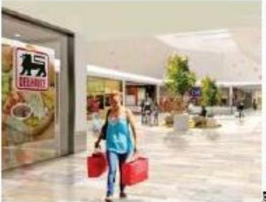
La galerie actuelle sera modernisée sans pour autant fermer ses portes.